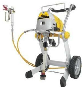
Project Pro 119 Extra