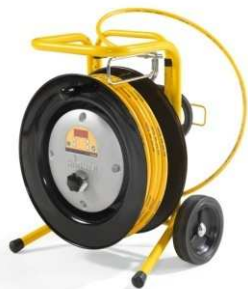
Manguera calefactada Tempspray H226